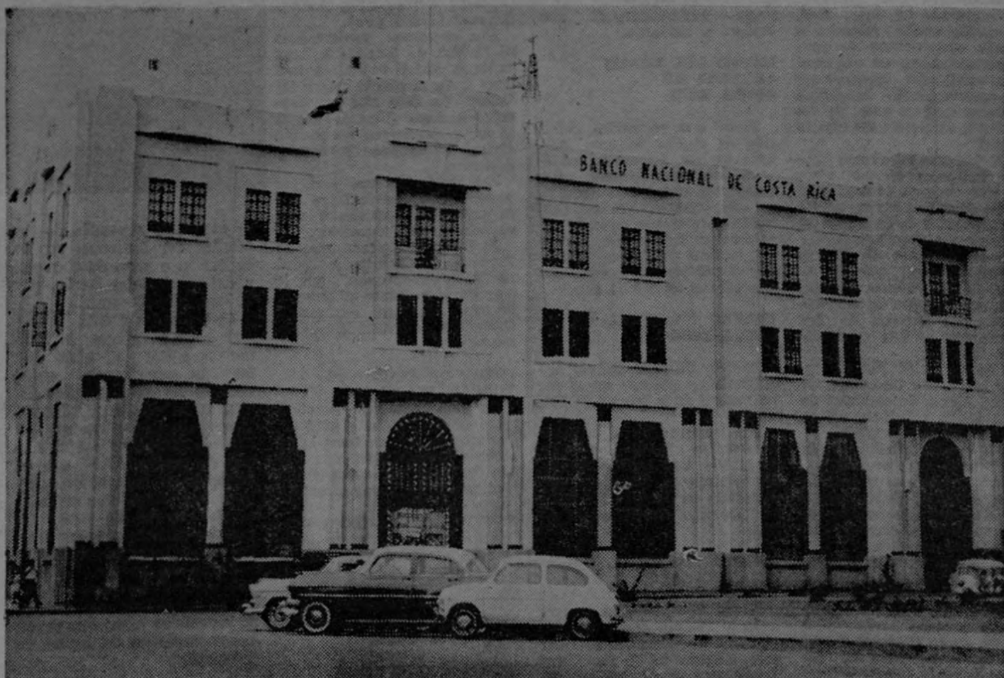
BANCO NACIONAL DE COSTA RICA